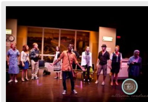
En Transit sera présentée du 25 juillet au 5 août 2011 dans des camps d'étés, des parcs publics et les centres communautaires de la grande région de Montréal.

Le jeudi 4 août 15 h 30 Camp Kanawana (St-Sauveur)